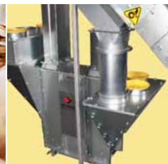
Tilkobling til innløpstrakt.