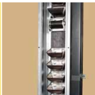
Antistatisk bøttereim med stålbøtter.

GALVANISERT ENERGIEFFEKTIV SERVICEVENNLIG KOMPAKT PÅLITELIG LETT Å MONTERE