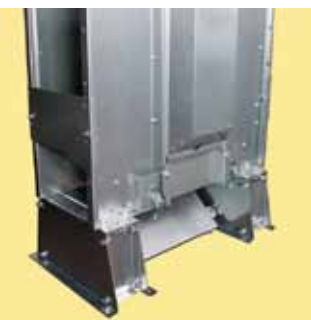
Såkornfot med høye føtter og bunnrenseluke med sikkerhetsbryter.